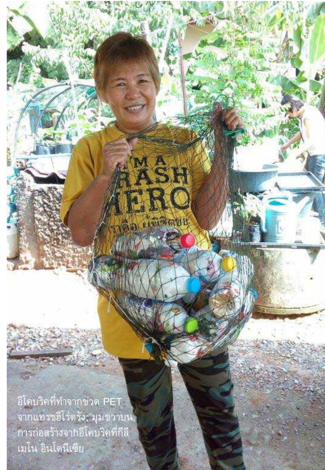
อิโคบริคส์ที่ทำจากขวด PET จากแทรชฮีโร่ตรัง: มุมขบวนการ ก่อสร้างจากอิโคบริคส์ที่กิล เมโน อินโดนีเซีย

กลุ่มแทรชฮีโร่สามารถสร้างโครงการของตัวเองในการ ป้องกันการเกิดขยะพลาสติกได้ แทรชฮีโร่อ่าวนาง ได้สร้าง สื่อเพื่อรณรงค์ให้ลดการใช้หลอด พลาสติก แทรชฮีโร่ อาเหม็ด ทำงานร่วมกับบาร์และร้าน อาหารในพื้นที่ในการเริ่มใช้หลอดดูดที่สามารถใช้ซ้ำได้แทนที่ พลาสติก ... ยังมีข้อมูลอีกมากในบทถัดไป