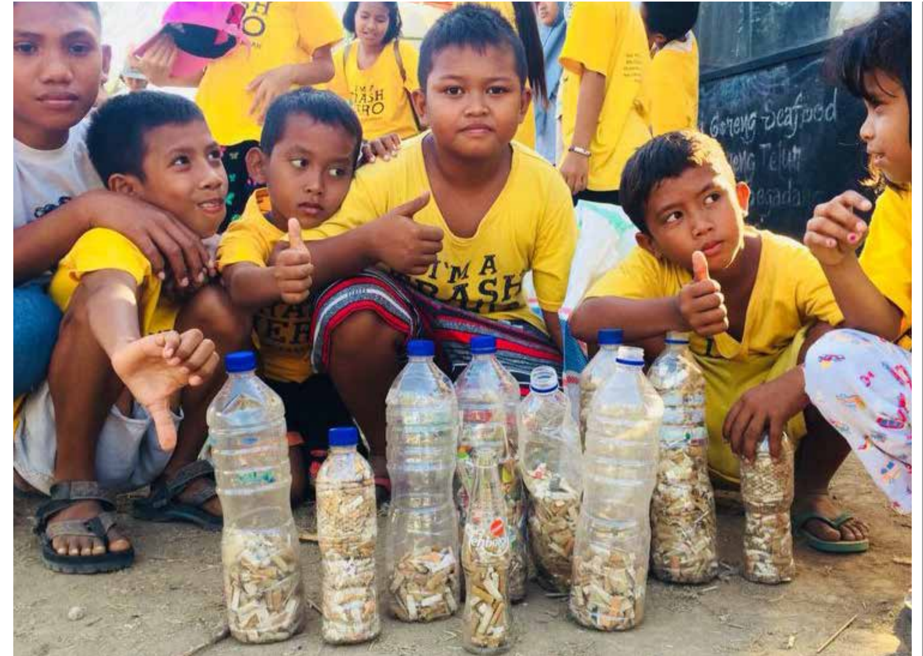
PET bottle ecobricks dari Trash Hero Komodo; kanan atas, konstruksi ecobrick di Trash Hero Amed, Bali

Anda akan menemukan banyak program kerja sama Trash Hero dengan organisasi-organisasi lain di situs kami .