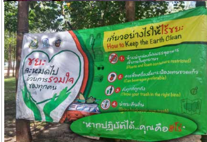
"Jika Anda melakukan ini, Anda adalah seorang pahlawan!"

bahwa ini hasil kerja Anda, ini adalah hal yang menakjubkan untuk dilihat dan sama berharganya dengan prestasi jumlah relawan.